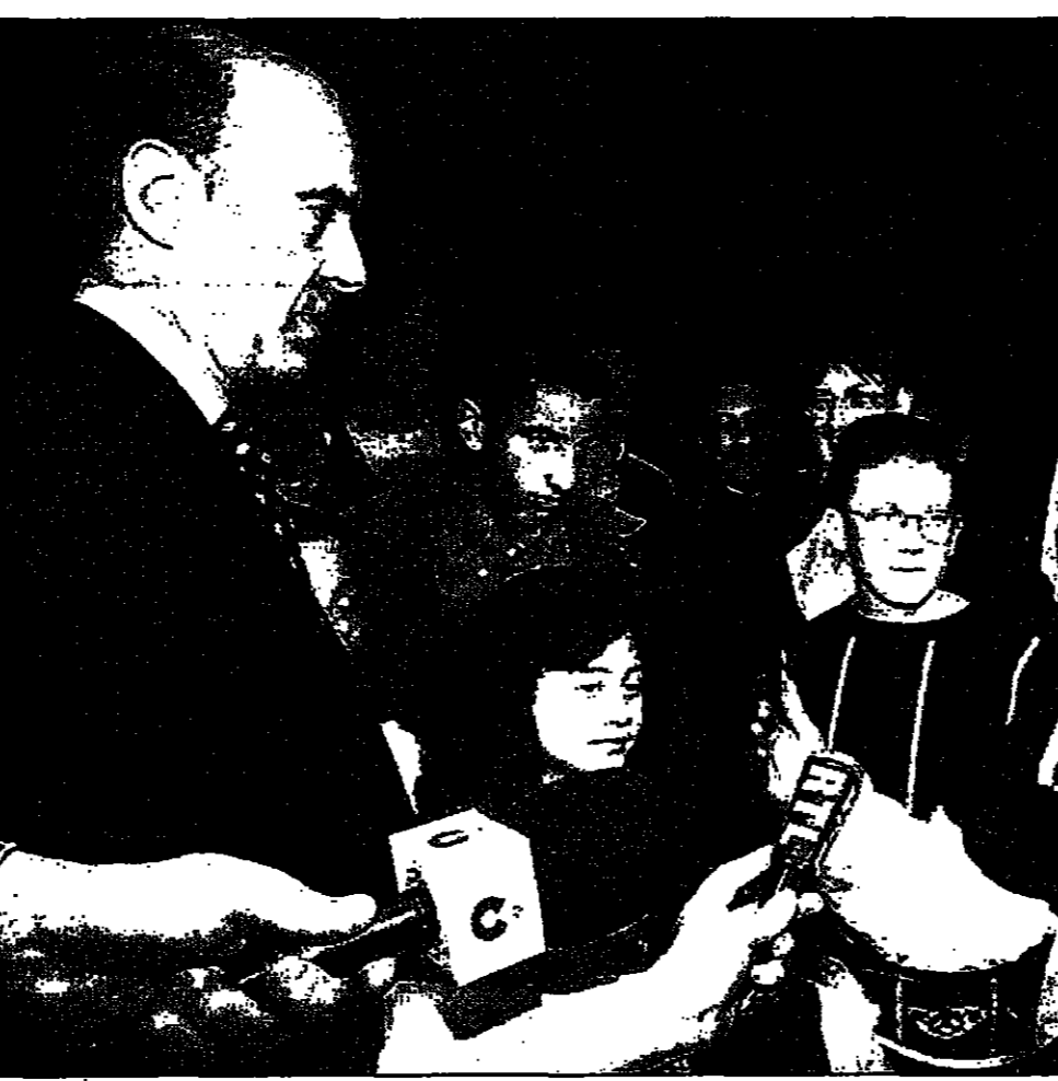
رئيس الوزراء الفرنسي آن جوييه يلتقي ببرنامج حزبه الانتخابي خلال جولة اجراءها أمس في مدينة تانسني

باريس - من جانا ميكوسكا - تلقى ترشيحات للتشجيع الذين لا يحقون بترشيحهم في الانتخابات التشريعية الفرنسية. وقال جوييه ان فرنسا ترى انه لا يمكن ايجاد حل دائم لكابيللا الذي تخبر ان انه من انتحالية منظمة تهدف إلى تخضير الانتخابات.